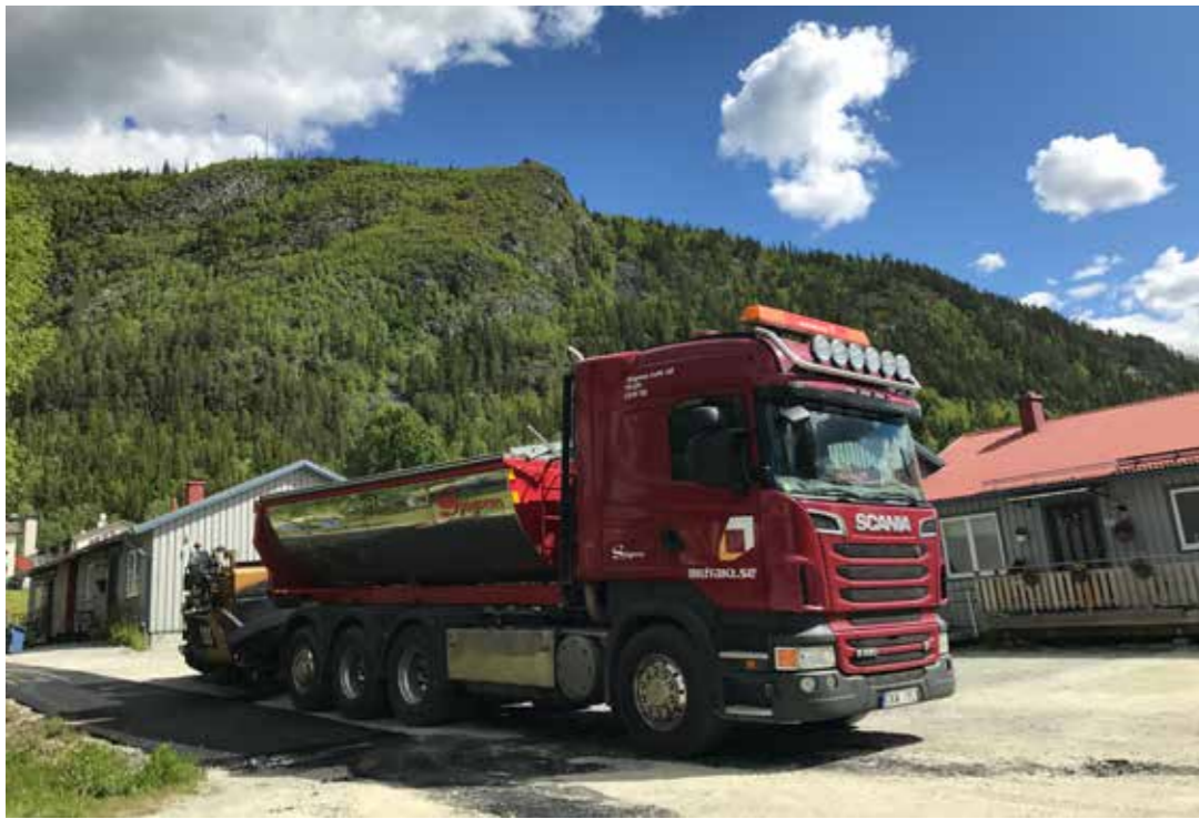
Anläggningsbil i arbete.