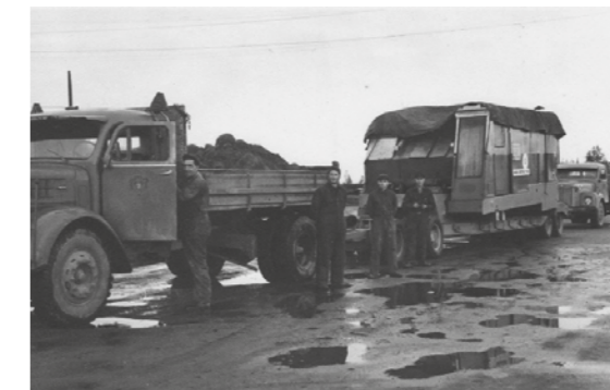
Sjögrens Trafik utför en transport av Marion Grävare.