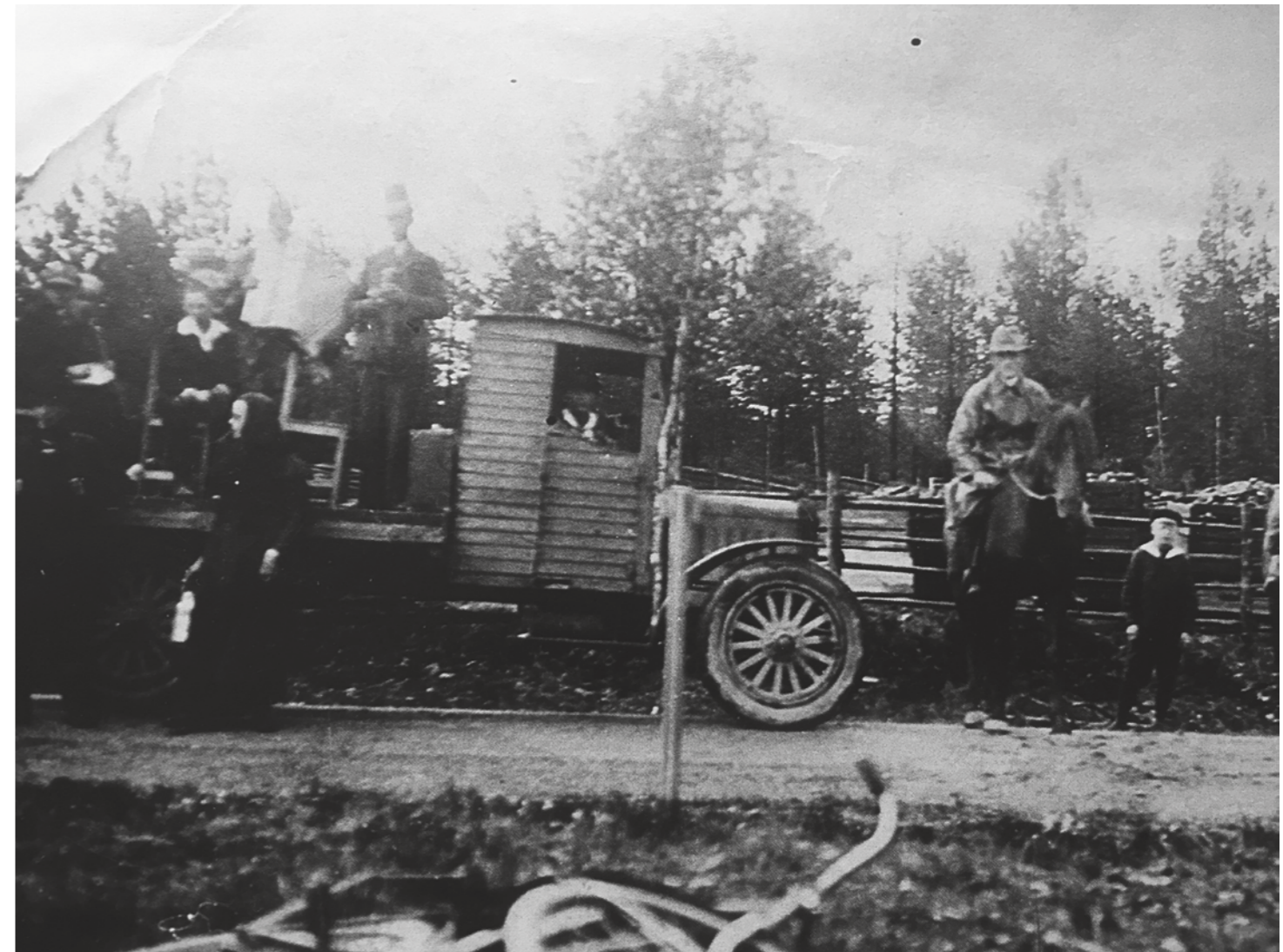
Sjögrens första bil. Kombitrafik redan då. Folk på helgen och gods på vardagen.

Bröderna Sjögrens Trafik även med rundvirkes-transporter och etablerade även traktorer i Umeå området.