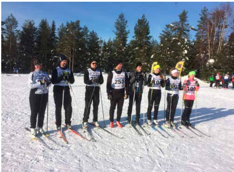
Några av tävlingsdeltagarna under RM.