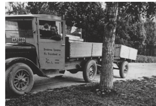
Sven Sjögren på strandgatan i Umeå nedanför stadshus- parken. Stads kyrkans torn i bakgrunden till höger. Bilen är en 1930 års Ford med en tjänstevikt på 1980 kilo och maxlast på 2 000 kilo.

Att skapa personaltrivsel så man får så liten personalomsättning tror bröderna är en av framgångarna för ett åkeri