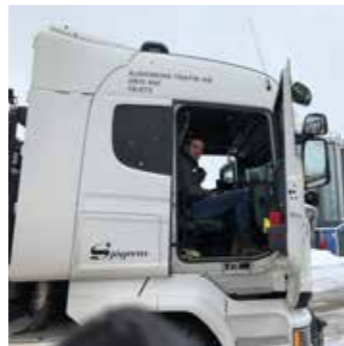
Besök från Designhögskolan i Umeå.