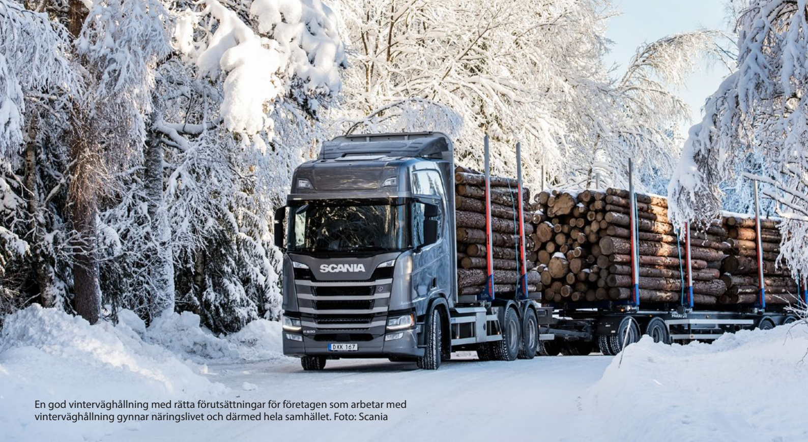
En god vinterväghållning med rätta förutsättningar för företagen som arbetar med vinterväghållning gynnar näringslivet och därmed hela samhället.